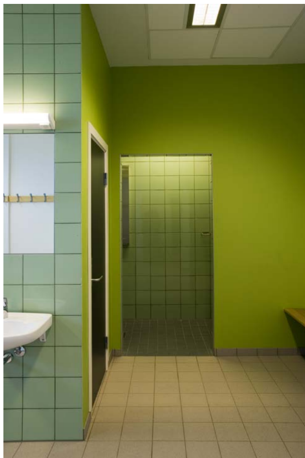
Duschrum på Kongseik Ungdomsskole